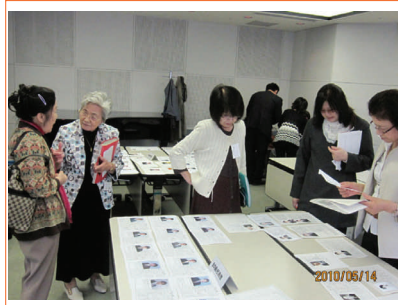
真剣に身上書を見つめます！！