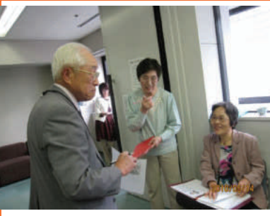
男性の先生もがんばっています

データに見る！ 結婚時に相手(旦那)は「少なくとも〇〇円はあって欲しい！」と思う金額 対象：未婚者、n=728/男性：417、女性：311