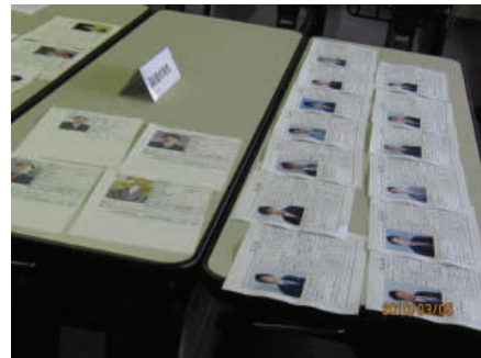
「和泉の会」は第1金曜日です (写真交換会)

5月も新しい支部長さんが13名(支部)増えました。支部が増えることは、同時に会員さまが増えるチャンスでもあります。是非、先輩の先生方に業界ノウハウを教えていただきながら会員様の幸せのためにご活躍いただきたいと思ひます。最初は手探りで分からないこともたくさんあると思ひますので、暖かいご指導とご支援をよろしくお願ひ致します。