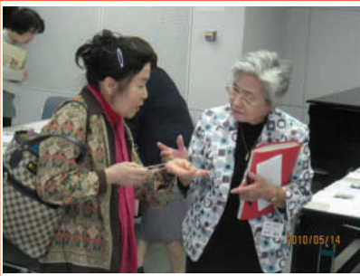
ついお互いに熱が入りますね！